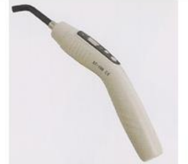
PIEZA DE MANO

Recuerde: El equipo Millennium II cuenta con una garantía de 1 año por defectos de fabricación y su tiempo empieza a regir desde que dicho producto es instalado en el lugar en el cual se hace el contrato de compra venta.